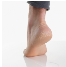
Avaliação de doenças